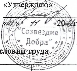
График проведения специальной оценки условий труда